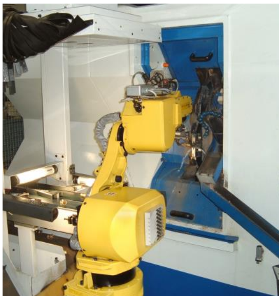
Macchinario Gnutti - IMT Armaturen

A TOOLS for SMART MINDS è richiesta la parte di scambio dati, quali la raccolta, l'analisi istantanee dei dati dai macchinari, il trasferimento automatico dal macchinario al server aziendale e viceversa.